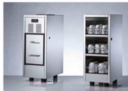
Leistungsfähige optionale Zubehör Module: Tassenwärmer und Kompressor Kühlschrank

Die Talento bereitet verschiedenste Getränke vollautomatisch zu: normaler Espresso, starker Espresso, langer Espresso, Cappuccino, Milchkaffee, Latte macchiato, Kaffee, heiße Milch, Tee und Aufgussgetränke. In einer kleinen Tasse oder in einem großen Glas: kein Problem, mit einer Ausgabehöhe von bis zu 19 cm. Mit den zwei professionellen Kaffeemühlen können verschiedene Kaffeemischungen eingestellt werden, um dem Geschmack der anspruchsvollsten Kunden nachzukommen.