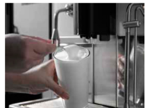
Das neue System zum Aufschäumen der Milch (Ausführung "Spezial") verleiht dem Schaum eine höhere Dichte und ermöglicht die Zubereitung von Getränken mit unterschiedlichen Temperaturen bis hin zur Zubereitung des "cold milk foam", d.h. einer kalt aufgeschäumten Milch als neues, besonderes Getränk, das Milchliebhaber begeistern wird.