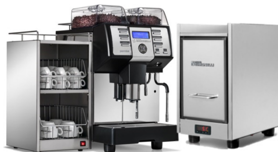
Leistungsfähige optionale Zubehör Module: Tassenwärmer und Pronto Frigo