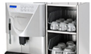
Leistungsfähige optionales Zubehör Modul: Tassenwärmer

Mit der neuen Brühgruppe und den neuen internen Bauteilen lassen sich mit der Microbar II Espresso und Cappuccino mit besonders hoher Konsistenz und ausgezeichneten Qualitätsmerkmalen herstellen. Mit dem System der doppelten Pressung können mit der gleichen Kaffeemischung unterschiedliche Ergebnisse je nach Bedarf erzielt werden.