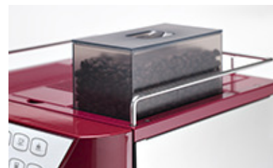
Bohnenbehälter je 0,25 kg *optionale Erhöhung möglich

Die Wahl der Farben perlweiß und rot lässt alle Möglichkeiten offen: weiß fügt sich nahtlos in die Umgebung ein, rot hingegen steht für die Nutzer, die eine Espressomaschine als sichtbares Objekt suchen.